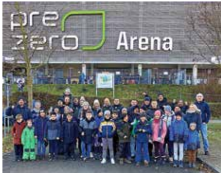
Die E2 Jugend beim Ausflug in Hoffenheim

auch einmal in echt zu sehen. Am Stadion gut angekommen, noch ein schönes Gruppenbild und schon ging es durch die Einlasskontrollen direkt zu den Verpflegungsständen. Wir stärkten uns dann mit Stadionwurst und kühlen Getränken bevor wir unsere Plätze einnahmen.