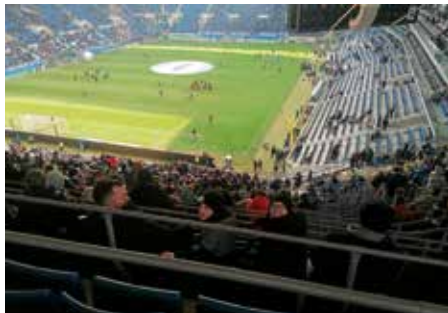
Rechtzeitig vor Ort, konnten wir den Profis schon beim Aufwärmen zuschauen.

Kurz darauf ging das Spiel endlich los. Die TSG startete leider schlecht und Leverkusen ging schnell mit 1:0 in Führung. Nach der Halbzeit erhöhte Leverkusen schnell auf drei Tore. Letztendlich gelang der TSG nur noch der Anschlusstreffer zum 1:3. Das war auch der Endstand. Hoffenheim hatte zwar verloren aber die Kids konnten zumindest vier Tore im Stadion sehen. Es war ein sehr schöner Nachmittag den unsere Jungs und Mädels so schnell nicht vergessen werden. Vielen Dank an alle die dabei waren.