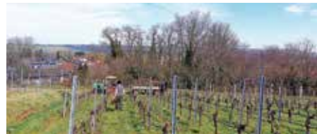
Rebbüschele sammeln bei bestem Wetter

Am Samstag stand der erste von zwei Terminen zum Rebbüschele sammeln an. Bei bestem Wetter konnte man mit einer kleinen Truppe 85 Rebbüschele sammeln, welche zum Anheizen des Backhauses für das Backhausfest und den Weihnachtsmarkt benötigt werden. Damit diese verheizt werden können, müssen die Rebbüschele 1-2 Jahre trocknen, weshalb man sie im alten Raiffeisen-Gebäude verstaut hat.