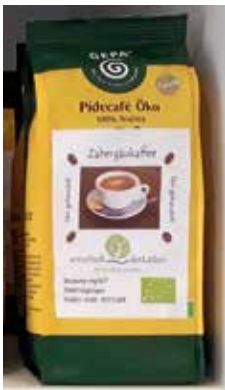
Zabergäukaffee, fair und bio

Bezahlen Sie für Ihren Kaffee einen fairen Preis?