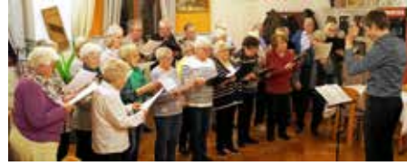
Der „Eröffnungs-Chor“ bei der Mitglieder-versammlung