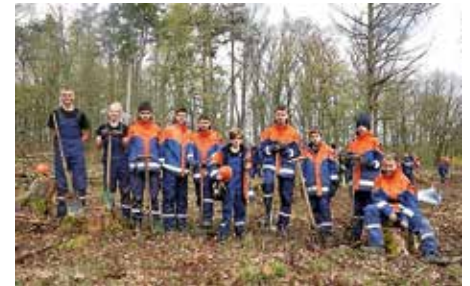
Teilnehmer des sozialen Projektes

Bestandteil der Jugendflamme 3, einem Abzeichen in der Jugendfeuerwehr, ist es, sich an einem sozialen Projekt in der Region zu engagieren. Also ging es am nächsten Tag für den Großteil der Jugendfeuerwehr Güglingen weiter nach Brackenheim. In diesem Jahr fiel die Wahl auf die Mithilfe bei der Wiederaufforstung eines Waldstücks. Vor Ort trafen wir uns mit den Jugendfeuerwehren aus Pfaffenhofen und Brackenheim sowie den zuständigen Förstern. Den Jugendlichen wurde gezeigt, wie man einen Setzling richtig einpflanzt und worauf man dabei besonders achten muss. Außerdem erklärten die Förster warum die Wiederaufforstung so wichtig ist und welche Unterschiede die verschiedenen Baumarten zueinander haben. Trotz der erschwerten Bedingungen durch den Regen wurden an diesem Tag ca. 400 Setzlinge eingepflanzt. Nach getaner Arbeit kehrten die Jugendlichen bei der Freiwilligen Feuerwehr in Brackenheim ein, um sich bei einer roten Wurst im Weck über den Tag auszutauschen.