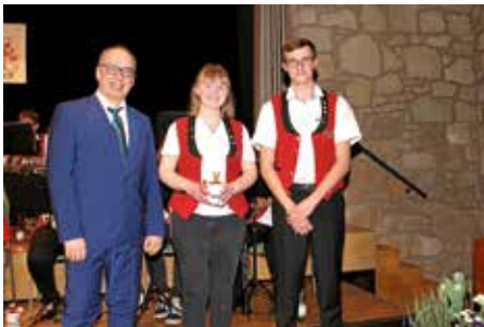
10-jähriges Jubiläum für Treue zum Verein