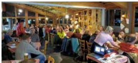
Bis auf den letzten Platz gefüllt: Die GSV-Gaststätte „La Vita Mia“.