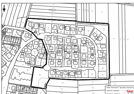
Gebiet „Herrenäcker-Baumpfad, Erweiterung“ Güglingen