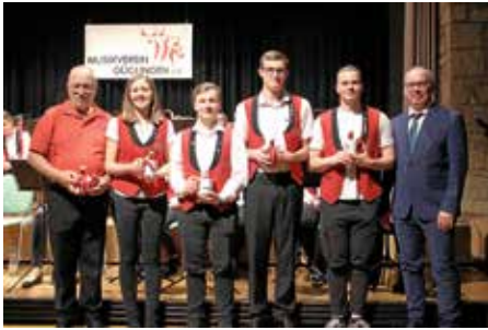
10-jähriges Jubiläum für Treue zum Verein