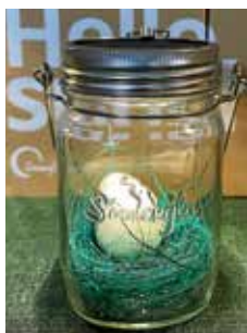
Sonnenglas mit Speckstein-Ei

Wie jedes Jahr werden wir auch in diesem Jahr unsere Türen geöffnet haben, um Ihnen unser Sortiment von fair gehandelten Lebensmitteln und Geschenkartikeln zu präsentieren. Zusätzlich haben wir am Laden einen Bücherflohmarkt aufgebaut, dessen Erlös der „Güglinger Tafel“