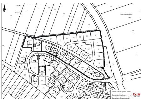
Gebiet „Ob der großen Hohle“ Frauenzimmern