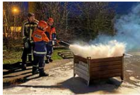
Löschen mit einem CO 2 -Löscher

Vergangenen Freitag, dem 24.03. trafen sich die Jugendlichen der Jugendfeuerwehren Güglingen und Zaberfeld, um den Umgang mit verschiedenen Löschmitteln zu üben. Nach einer kurzen theoretischen Unterweisung starteten die Jugendlichen in den praktischen Teil. So konnte jeder jedes Löschmittel an einem realen Feuer ausprobieren. Die Jugendlichen lernten unter anderem wie man einen Feuerlöscher einsatzbereit macht, welcher Feuerlöscher für welche Brandklasse geeignet ist und wie sich das Feuer bei den verschiedenen Arten von Feuerlöschern verhält. Des Weiteren wurden Löschmittel getestet, die im Haushalt daheim nicht zu finden sind. Die Jugendlichen bekamen gezeigt, wie man das Schaummittel und die sogenannte Kübelspritze der Feuerwehr benutzt. Ziel dieser Übung war es, das Verständnis für die unterschiedlichen Löschmittel zu steigern und erste praktische Erfahrungen zu sammeln. (Bild 1)