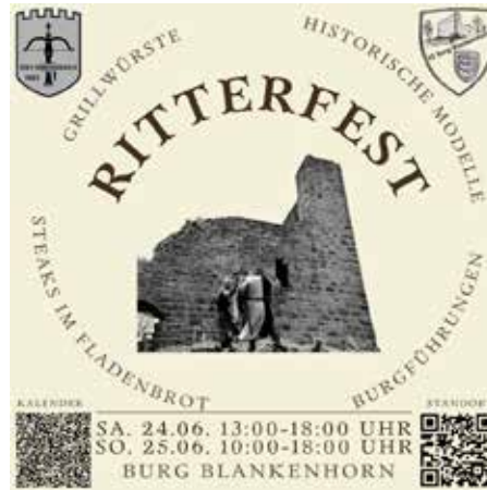
Der Flyer zum Ritterfest

auf unseren Social-Media-Kanälen findet ihr weitere Informationen zur Anreise und den Parkmöglichkeiten.