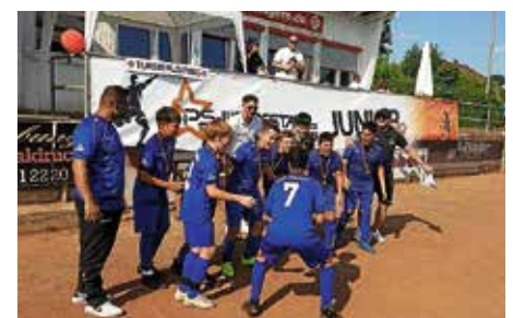
Die D-Junioren bei der Pokalübergabe zum 1. Platz