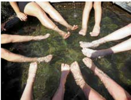
Dank an den Haberschlechter Dorfbrunnen