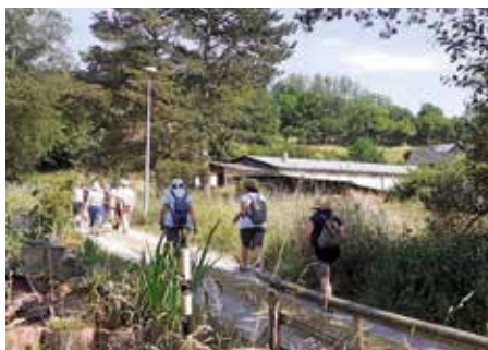
Unterwegs rund um Oberöwisheim