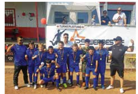
Die D-Junioren der SGM Güglingen Frauenzimmern