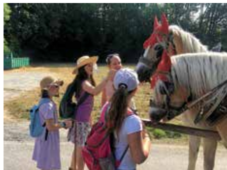
Mädchen und Pferde :-)