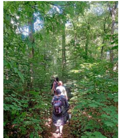
„Waldbaden“ – willkommene Abkühlung