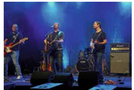
Rockig gings am Sonntagabend zu