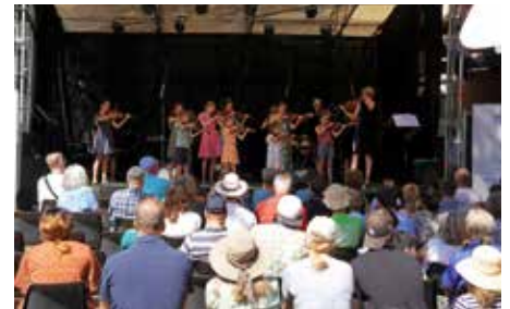
Schülerkonzert begeisterte Alt und Jung

Im Anschluss gab es das große Sommerkonzert der Musikschule Lauffen und Umgebung. Trotz der Hitze fanden viele Gäste noch einen Schattenplatz unter den Schirmen und konnten Jugendsinfonieorchester, Band, Akkordeon-Ensemble, Gesang und noch mehr lauschen.