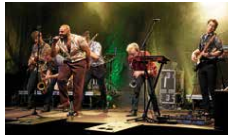
Beim Konzert von Fatcat blieb niemand sitzen

Außerdem waren FATCAT an diesem Tag im Deutschen Hof zu hören. Funk, Soul und Disco vereint zu einem groovigen Sound bewegten am Ende selbst den schüchternsten Gast dazu sein Tanzbein zu schwingen – ein absolutes Super-Konzert.