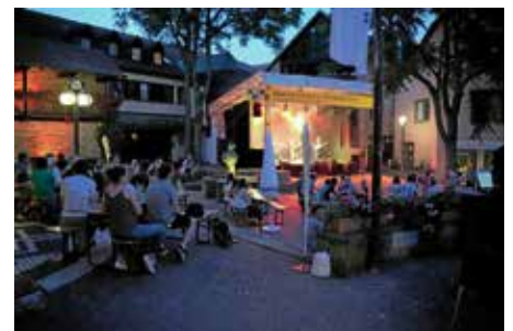
Stimmungsvoll in die Nacht

Die Stadt Güglingen bedankt sich hiermit bei allen Helfern und Unterstützern. Durch Ihr Dazutun und das Sponsoring ist dieses Angebot erst möglich. Besonderer Dank geht an die Firma Layher Gerüstbau für die großzügige Unterstützung.