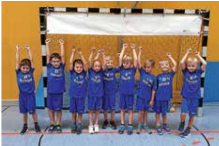
Die kleinen Spieler jubeln wie die Großen

Mit großer Aufregung startete unsere neue F-Jugend am vergangenen Samstag in Mosbach in die neue Spielsaison. Trotz kleiner Verfehlungen in der Nebenspielform Turmball, konnten wir uns großer Erfolge im Hauptspiel erfreuen.