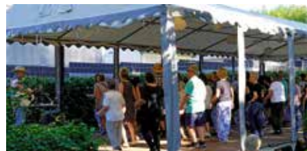
Getanzt wurde auch im Biergarten

Ein Doppeldate gab es für den ZUG Musik Pub mit einem besonderen Barbecue-Angebot für zwei Tage. Dazu gab es am Freitag einen tollen Mix vom DJ mit Classic Rock auf die Ohren und am Samstag versammelten sich Fans des Line-Dance zur Live-Musik von Old H.A.G. Der super Sound war wohl schon bekannt, denn der Biergarten war proppenvoll.