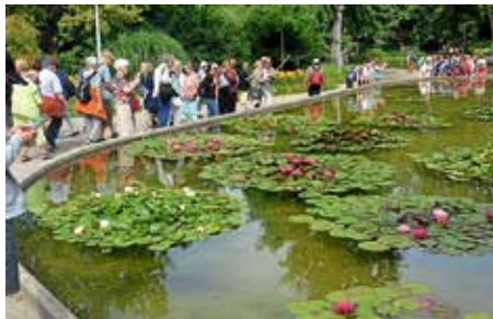
Gruppe am Seerosenteich

Gut angenommen wurde dieser Ausflug mit über 50 Anmeldungen, sodass ein größerer Bus als ursprünglich geplant, gechartert werden musste. Nach der pünktlichen Abfahrt um 8 Uhr konnten die beiden Führungen im Luisenpark mit je 25 Personen sogleich in Angriff genommen werden. Auf dem eineinhalbstündigen Weg kam man an verschiedenen gärtnerischen Highlights vorbei. Blühende Staudenbeete, der Mittelmeergarten, Freizeitwiesen, die Gärten der zwölf Partnerstädte und die prächtig blühenden Seerosen konnten bewundert werden. Während des Rundgangs wurde das Konzept der Stadt Mannheim für die Weiterentwicklung des Luisenparks erläutert. Mannheim erhält mit der BUGA 23 eine neue Parkmitte, bei der Landschaft und Architektur eine Symbiose eingehen. Wert wird auf gärtnerische Vielfalt gelegt. Der Park ist für Familien mit Kindern extrem attraktiv, weil sehr viele Spielplätze und schattige Aufenthaltsorte vorhanden sind, sodass man trefflich picknicken kann. Der Matschspielplatz ist bei den Kindern besonders beliebt.