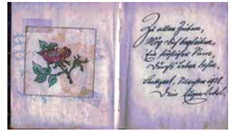
Seite aus einem Poesiealbum