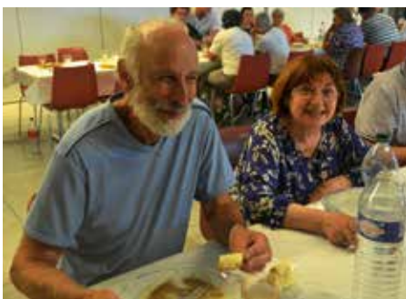
Abschiedsessen im Espace Dagron in Auneau