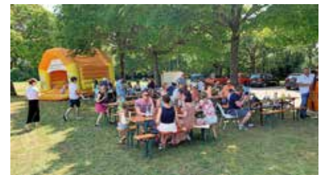
Hüpfburg und geselliges Beisammensitzen

Allen Akteuren, Helfern und Kuchenspendern ein ganz großes Dankeschön. Toll, dass wir wieder zusammen feiern konnten!