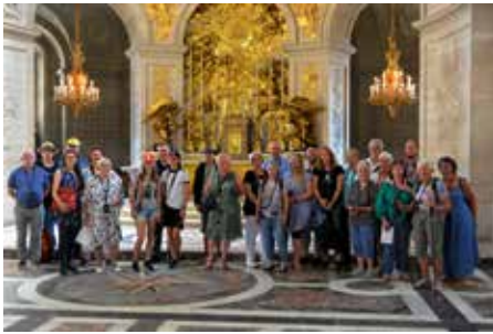
In der Kapelle vom Schloss Versailles