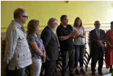
Offizieller Empfang im Rathaus von Auneau