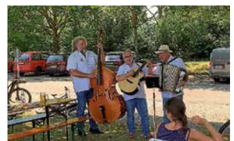
Die Musikanten „Die 3 Richtigen“