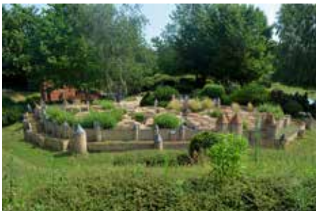
Nachbildung von Carcassonne im Park „France Miniature“