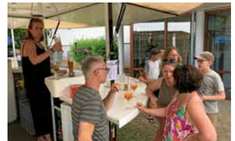
Auf ein Schwätzchen an der Bar