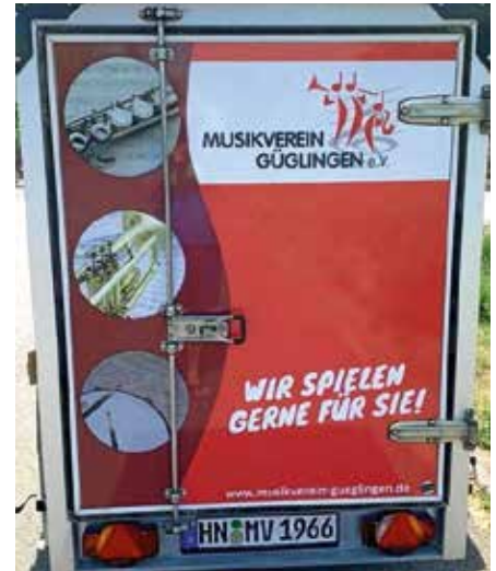
Die Rückseite wurde bereits im März neu gestaltet

Im Vorstand wurden seit Ende des vergangenen Jahres alle eingereichten Motive diskutiert und immer wieder neue Verbesserungsvorschläge integriert, bis das finale Motiv für die Seitenwände, sowie die Vorder- & Rückseite stand.