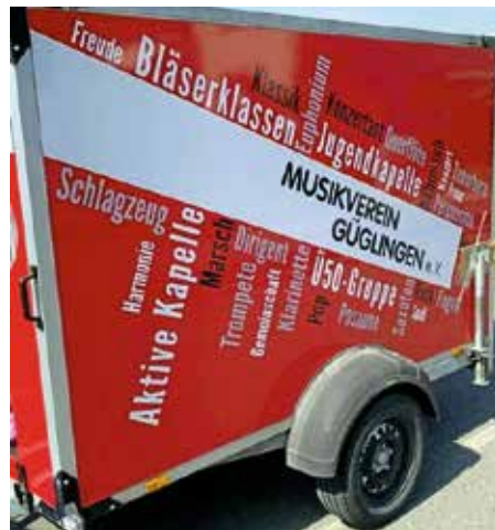
Seitenansicht des neu folierten Anhängers

Seit über 10 Jahren ist der Musikverein Güglingen e. V. im Besitz eines geschlossenen Pkw-Anhängers zum Transport von Instrumenten, Equipment und Bewirtungsutensilien. Dieser wurde damals mit Hilfe vieler Sponsoren finanziert und mit deren Firmenlogos beklebt. Dadurch, dass der Anhänger seitdem öffentlichkeitswirksam unter freiem Himmel steht, wurde es nun Zeit, die alte, bereits abblättern- de, Folierung gegen ein moderneres Design zu tauschen. Bereits vor unserem Frühjahrskonzert im März 2023 mussten wir die Folierung an der Türe erneuern, da schon die Grundplatte aus Holz zu sehen war und wir einen bleibenden Schaden an dieser Platte verhindern wollten.