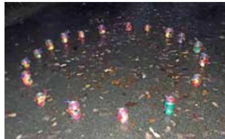
Unsere selbst gebastelten Herbstlichter

mit ihren wunderschönen Laternen durch die Straßen. An einigen Orten konnte man während dieser Zeit dem Gesang von Laternenliedern lauschen und einen langen Umzug voller leuchtender Laternen bestaunen.