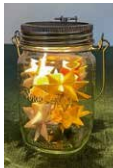
Sonnenglas aus Südafrika

Seit Jahren führen wir in unserem Fachgeschäft des Fairen Handels „eineWelt-derLaden“ das Original-Sonnenglas. Es wird in Kapstadt (Südafrika) fair hergestellt. Die Frauen und Männer in dieser Manufaktur werden übertariflich bezahlt, bekommen eine Versicherung und den Anspruch auf eine Pension. Die faire Bezahlung allein ist nicht alles. So hat der europäische Vertriebs für das „Sonnenglas/Consol SolarJar™“ einen Fonds eingerichtet, der eine Stunde pro Tag während der Arbeitszeit die weitergehende Ausbildung der Mitarbeitenden in Mathematik und engli-