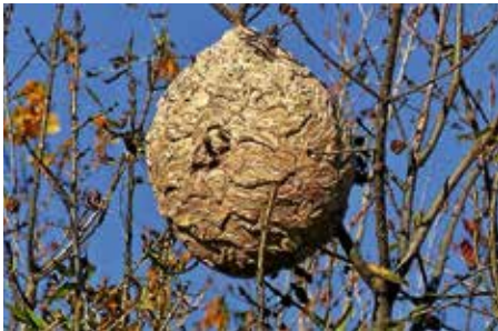
Nest der asiatischen Hornisse in Michelbach

Damit die Tiere nicht überhandnehmen, müssen die Nester gesucht und vernichtet werden. Diese befinden sich meist in großer Höhe in Bäumen. Da der Laubfall eingesetzt hat, werden die Nester sichtbar.