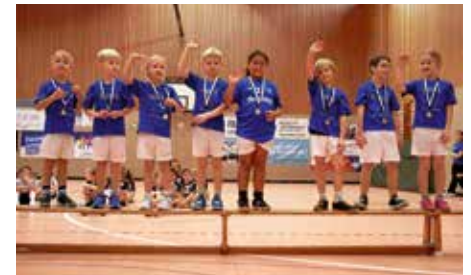
Große Freude bei der F-Jugend

Durch das Ausfallen von zwei weiteren Teams konnten unsere gut gelaunten Kids in einem weiteren außerplanmäßigen Aufsetzerhandballspiel den Sieg erringen. Zum Abschluss haben die Kinder stolz ihre wohlverdienten Medaillen in Empfang genommen.