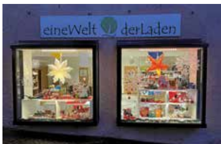
„EineWelt-derLaden“ im Dezember

Mo.–Sa.: 9.30 bis 12.30 Uhr und Mo.–Fr.: 14.30 bis 18.00 Uhr.