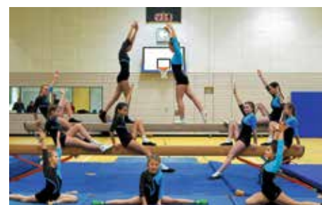
Balanceakt am Schwebekalken.