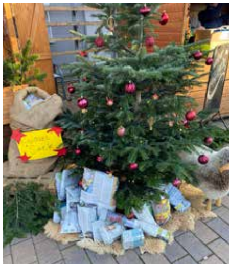
Geschenke aus dem Krabbelsack

Herzlichen Dank an alle, die uns durch ihren Kauf unterstützt haben. Aus den Einnahmen wird wieder eine tolle Überraschung für die Kinder organisiert. Liebe Grüße, ihr Elternbeirat