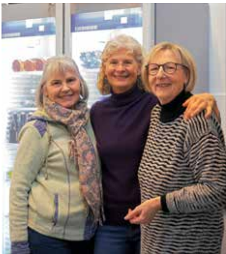
Viel Spaß hatten unsere Damen vom Bewirtungsteam in der Küche.

Nachdem die Nikolausfeier am Samstag einen gemütlichen Ausklang gefunden hat, gilt es Danke zu sagen. Danke an alle Kinder und Jugendliche, welche mit ihren Trainern und Übungsleitern zu diesem tollen Programm beigetragen haben, an alle Mamas und Papas, die einen Kuchen gebacken haben.