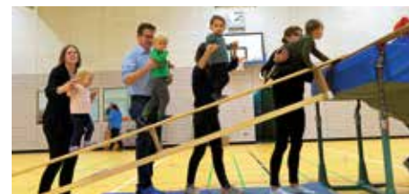
Eine lustige Schlittenfahrt präsentierte die Eltern-Kind-Abteilung.

In der Pause stärkte sich dann rund 200 Gäste an dem Kuchenbüfett, das für alle Teilnehmenden etwas zu bieten hatte. Vor dem Eingang konnten gegrillte Würste verzehrt werden. Nach der Pause ging es winterlich weiter mit den Minis. Wilde Sprünge zeigten danach die Turnkinder. Beim letzten Programmpunkt „Balanceakt auf verschiedenen Ebenen“ zeigten unsere Turnerinnen eine äußerst faszinierende Darbietung. Bei spektakulären turnerischen Sprüngen, Bewegungen und akrobatischen Elementen staunten alle Zuschauerenden über die Leistung der jungen Nachwuchs-Turnerinnen.