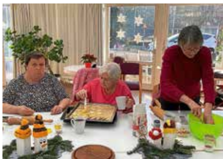
In der Weihnachtsbäckerei Gartacher Hof

Anmelden können Sie sich telefonisch in Güglingen unter 07135/16421 oder per E-Mail an weinsteige@d-hoim.de .