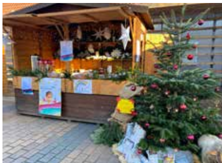
Weihnachtlich geschmückter Verkaufsstand

Bei schönem Winterwetter war die Gottlieb-Luz-Kita auch in diesem Jahr wieder beim Weihnachtsbummel mit einem Verkaufsstand dabei. Organisiert vom Elternbeirat und durch die Unterstützung vieler Eltern wurden Waffeln, Punsch, Popcorn und Geschenke aus dem Krabbelsack verkauft.