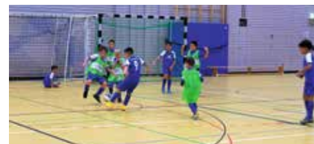
Die Bambinis zeigten ihr Können.

In der Pause stärkte sich dann rund 200 Gäste an dem Kuchenbüfett, das für alle Teilnehmenden etwas zu bieten hatte. Vor dem Eingang konnten gegrillte Würste verzehrt werden. Nach der Pause ging es winterlich weiter mit den Minis. Wilde Sprünge zeigten danach die Turnkinder. Beim letzten Programmpunkt „Balanceakt auf verschiedenen Ebenen“ zeigten unsere Turnerinnen eine äußerst faszinierende Darbietung. Bei spektakulären turnerischen Sprüngen, Bewegungen und akrobatischen Elementen staunten alle Zuschauerenden über die Leistung der jungen Nachwuchs-Turnerinnen.