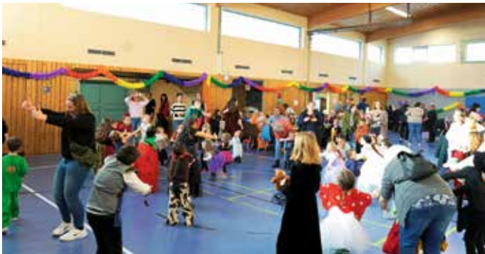
Musik, Tanz und große Faschingsfreude kam bei den vielen Besuchern auf.