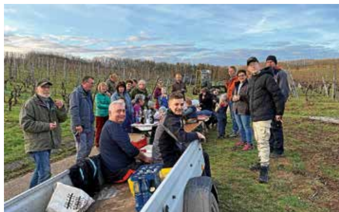
... gibt es eine verdiente Pause