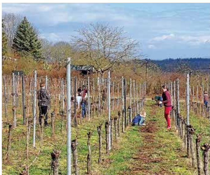
Da ist was los im Wengert

Bei herrlichem Sonnenschein traf sich eine ansehnliche Truppe von Helferinnen und Helfern zum Reben Lesen am Reisenberg. Emsig und gut gelaunt wurden die Zweige zurechtgeschnitten und in ordentliche „Büschele“ gebunden, und trotz der schweißtreibenden und Muskelkater versprechenden Arbeit hörte man häufig Gelächter durch die Weinberge schallen. Sogar die Kleinsten halfen fleißig mit und ohne sie wären wir nicht so schnell fertig geworden. Dank einer sehr guten Verpflegung konnten wir auch nach der Pause die fehlenden 50 Büschele zügig zusammenlesen. Mit den Büscheln wird im September wieder der Steinofen im Backhaus Frauenzimmern befeuert. Wir freuen uns jetzt schon auf leckere Zwiebel- und Kartoffelkuchen. Den Termin dafür gerne schon vormerken: 07.09.2024 Zwiebelkuchenfest!