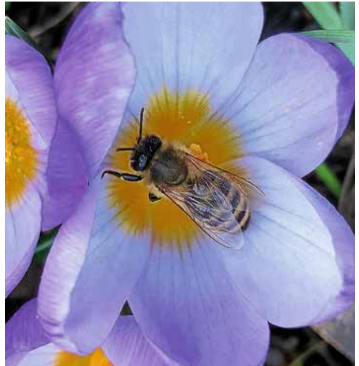
Wichtige Nahrungsquelle im Garten