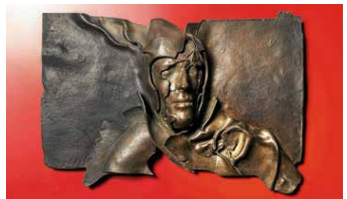
Gunther Stilling: „La Guerre de Troie (avait bien lieu)“ (1976)

Am Sonntag: Öffentliche Führung durch die Sonderausstellung „Gunther Stilling – Antike. reloaded.“