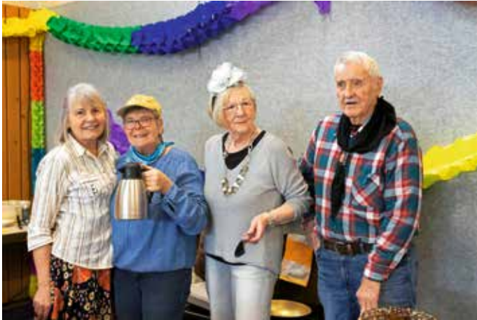
Das Helferteam ist immer fröhlich.

Mitmachgeschenke. Der Vorstand freut sich sehr über die vielen Mitglieder, Freunde, Unterstützer und Gönner, die sich mit Freude einbringen, damit so ein schöner Nachmittag stattfinden kann.