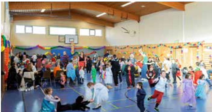
Der TSV-Kinderfasching wurde gut besucht.