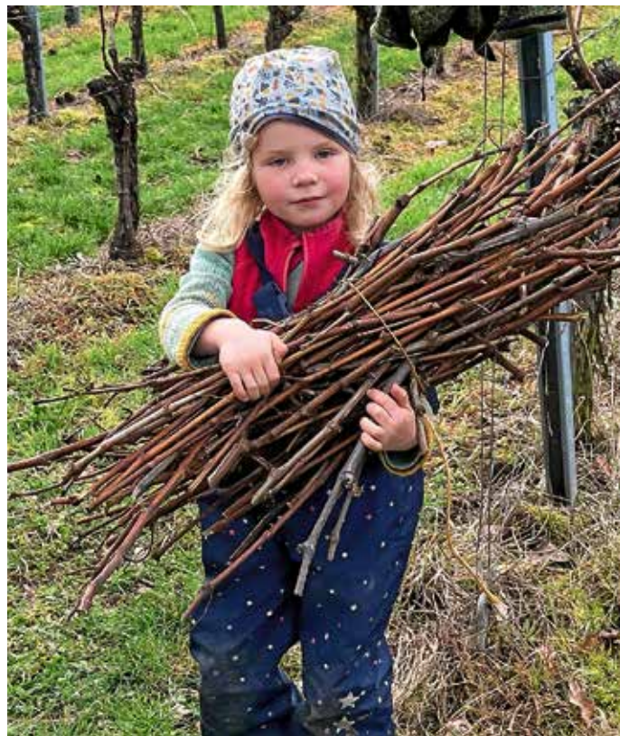
Nach getaner Arbeit ...

Bei herrlichem Sonnenschein traf sich eine ansehnliche Truppe von Helferinnen und Helfern zum Reben Lesen am Reisenberg. Emsig und gut gelaunt wurden die Zweige zurechtgeschnitten und in ordentliche „Büschele“ gebunden, und trotz der schweißtreibenden und Muskelkater versprechenden Arbeit hörte man häufig Gelächter durch die Weinberge schallen. Sogar die Kleinsten halfen fleißig mit und ohne sie wären wir nicht so schnell fertig geworden. Dank einer sehr guten Verpflegung konnten wir auch nach der Pause die fehlenden 50 Büschele zügig zusammenlesen. Mit den Büscheln wird im September wieder der Steinofen im Backhaus Frauenzimmern befeuert. Wir freuen uns jetzt schon auf leckere Zwiebel- und Kartoffelkuchen. Den Termin dafür gerne schon vormerken: 07.09.2024 Zwiebelkuchenfest!