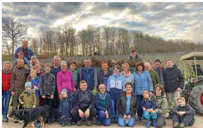
Ein Teil der Helferschar