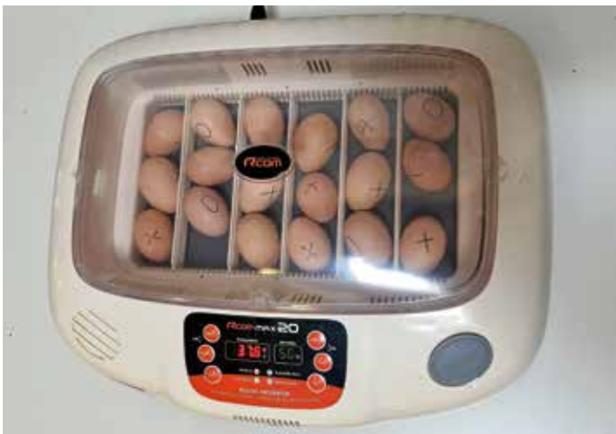
Brutkasten in der Kita

Der beginnende Frühling und das lebendige Erwachen beschäftigen uns in der Kita Heigelinsmühle seit einigen Tagen. Da auch das Osterfest mit großen Schritten näher rückt, begleitet uns das Bilderbuch „Das Osterküken“ durch diese Zeit. Wie neues Leben entsteht, dürfen die Kinder bei uns in diesem Jahr anhand eines ganz besonderen Highlights beobachten: Wir brüten Hühnereier aus!