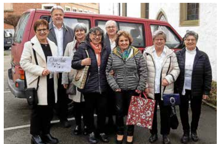
Der Chor Classic mit Erhards Tourbus