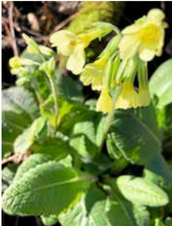
Schlüsselblumen zwischen Eibensbach und Cleeborn