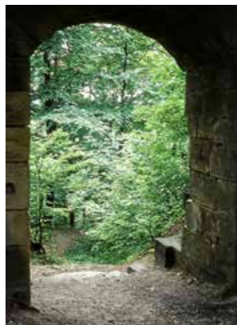
Burgtor von innen um 1957

An diesem Samstag werden wir weiter die Sanierung der inneren Pallasmauer vorantreiben. Außerdem stehen noch einige Baumschneideaktionen auf dem Programm. Für das leibliche Wohl wird wie immer bestens gesorgt. Bitte bringen Sie Teller und Besteck selbst mit, für den Rest sorgt die IG.