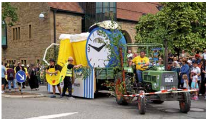
Fantasievoll gestaltete Umzugswagen sind ein Markenzeichen des Güglinger Maifests.

Noch fünf Wochen bis zum Maifest. Aufgrund des Festbetriebs sind von Freitag, 17. Mai, bis Montag, 20. Mai, die Weinsteige ab dem Gebäude Weinsteige 4 sowie die Rieslingstraße voll gesperrt. Für den Festumzug am Pfingstmontag, 20. Mai, sind in der Zeit von 13.15 bis 16.00 Uhr ebenfalls in der Innenstadt Sperrungen zu beachten, vor allem zwischen Oskar-Volk-Straße, in der Stockheimer und Kleingartacher Straße, Maulbronner Straße, West- und Wilhelmstraße, Eibensbacher Straße, Garten- und Lindenstraße, Heilbronner Straße und Marktstraße.