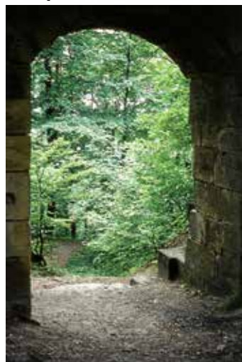
Burgtor von innen um 1957

An diesem Samstag bereiten wir die Burg für den Infotag am 1. Mai vor und schließen die Mauerarbeiten des letzten Einsatzes ab! Treffpunkt um 9.00 Uhr am alten Sportplatz in Eibensbach. Wir freuen uns über jeden freiwilligen und interessierten Helfer!