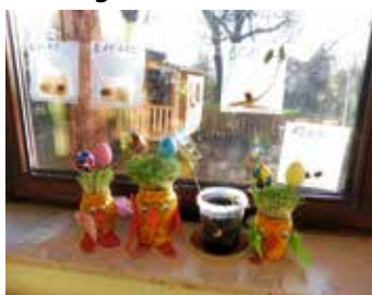
Kressenküken und Feuerbohnen

Unter dem Projektthema: Die Natur erwacht: Halleluja! Durch Gott wird alles neu! konnten die Kinder im Kindergarten Frauenzimmern in den vergangenen Wochen durch ganz unterschiedliche Projekte erleben, wie im Frühling alles wieder zum Leben erweckt wird. Mit viel Begeisterung haben die Kinder gemalt, ge-