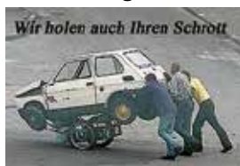
Wir holen auch Ihren Schrott

Bitte unterstützen Sie unsere Aktion. Alle Schrott- und Metallteile werden direkt vor Ihrem Haus abgeholt. Gesammelt werden: Sämtliche Stahl- und Metallschrotte, Kabel, Fahrräder, Heizkörper, usw. Einfach alles, was aus Stahl und Metall ist!