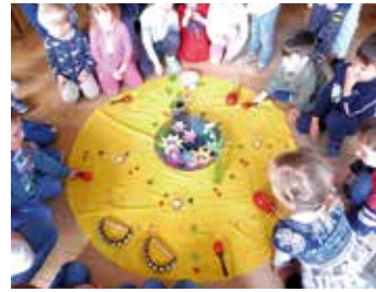
Die aufblühenden Papierblumen sorgten für viel Begeisterung.

bastelt und Experimente gemacht. Besonders spannend war es, zu beobachten, wie Feuerbohnen keimen und wachsen, wie schnell Kresse in den als Küken beklebten Gläsern wächst und wie Regenwürmer sich in der Erde bewegen.