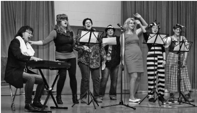
„Wer weiß, was kommt?“ Mit dieser Frage animierte der junge Chor „Sing4fun“ das Publikum bei der GSV-Winterfeier sehr effektiv zum Mitsingen.