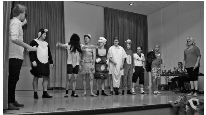
Die Fußballer ermittelten mit Publikums-Gunst den „Mister GSV“.