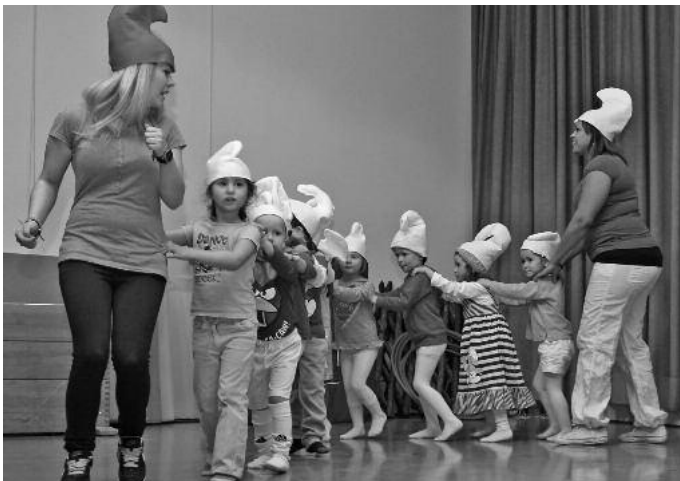
Die Turnkinder als tanzende Schlümpfe