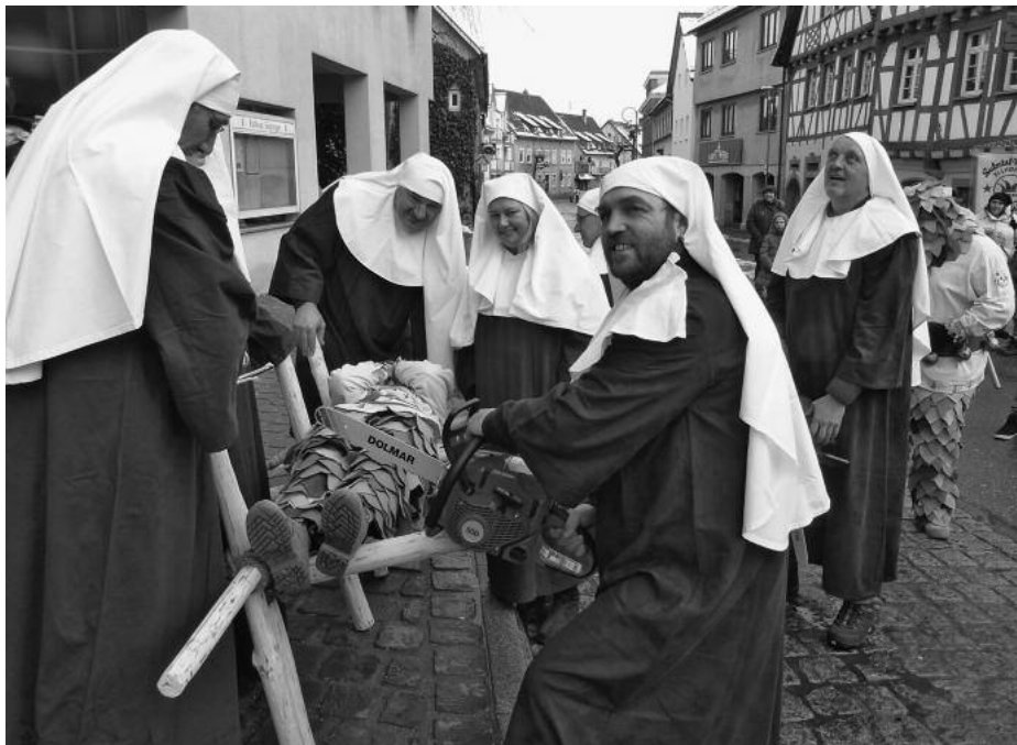
Die Stadträte in diesem Jahr kaum zu erkennen unter ihren langen Nonnenkutteln.