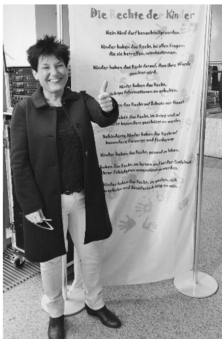
Sozialministerin Katrin Altpeter vor der „Kinderrechteflagge“ – die sie offensichtlich „klasse“ fand.