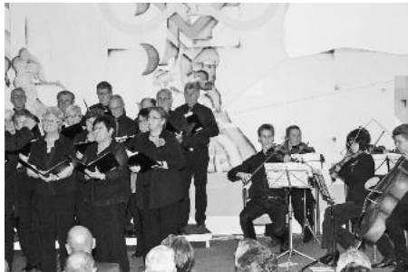
Chor und Orchester bildeten eine Einheit: Der Liederkranz Güglingen und die Camerata Juvenalis musizierten gemeinsam beim Konzert „Laudamus“ in der Güglinger Mauritiuskirche.