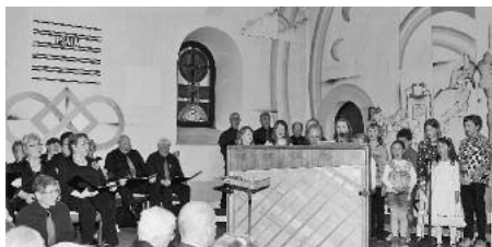
Stimmstärker trugen die jungen Sänger des Kinderchores Oberes Zabergäu ihre Stücke zweistimmig mit dem Liederkranz vor.