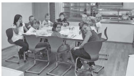
Grundschüler beim Mittagessen

Das Mittagessen wird von „Hausgemacht Bio-Catering“ aus Sulzfeld geliefert.