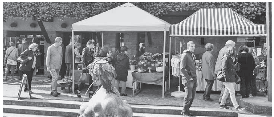
Die Veranstaltung Kunst in Güglingen zog erneut viele Besucher in die Zabergäu-Stadt. Einzelhändler, Gastronomie und Künstler präsentierten sich.