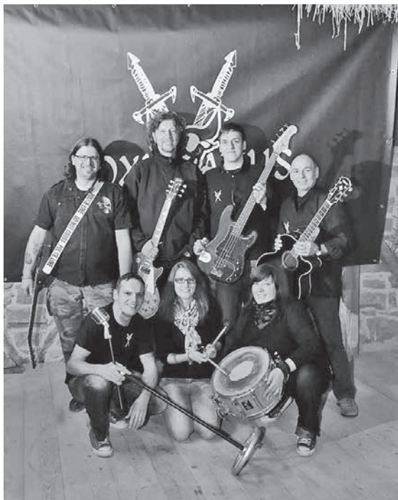
Mit der Ochsenburger Band Oxuvatus hat der Handels- und Gewerbeverein Pfaffenhofen eine echte regionale Größe an Land gezogen.

Aus einer Laune heraus ist die Band der Weizenbierfreunde Ochsenburg 2010 entstanden, die Resonanz war groß und die Musiker beschlossen, weiter zusammen Musik zu machen. Immer öfter