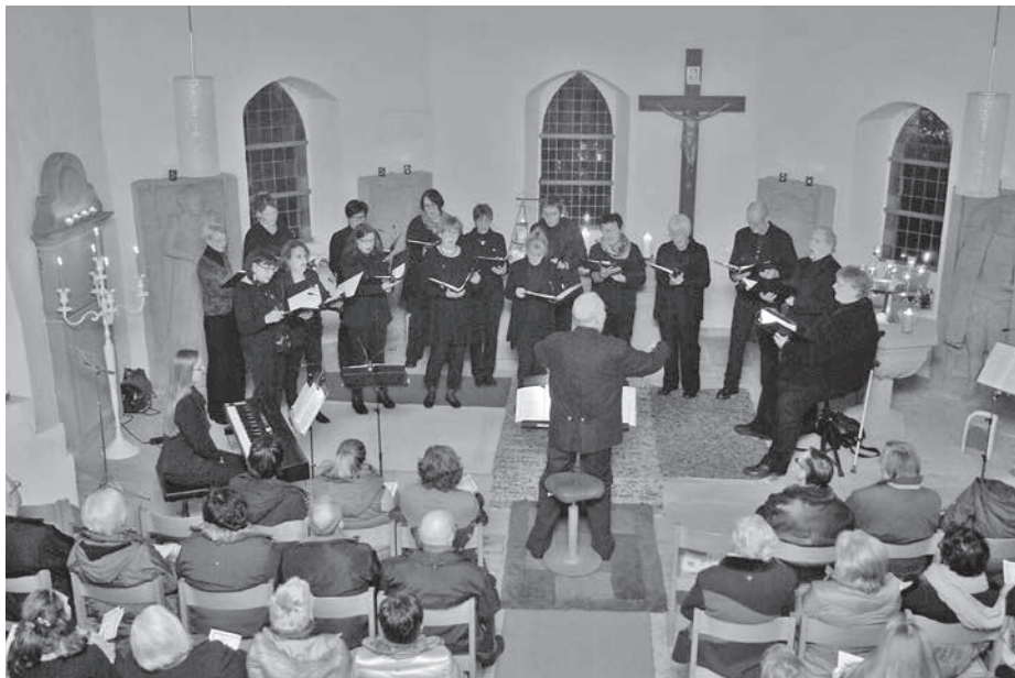
MerCurions KlangKultur verzauberte 120 Gäste bei Kerzenlicht in der Leonhardskapelle mit Advents- und Weihnachtsmusik.