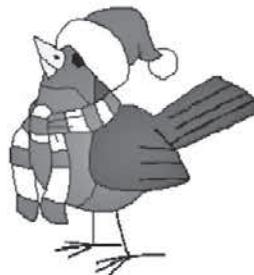
Klaus Dieterich Bürgermeister