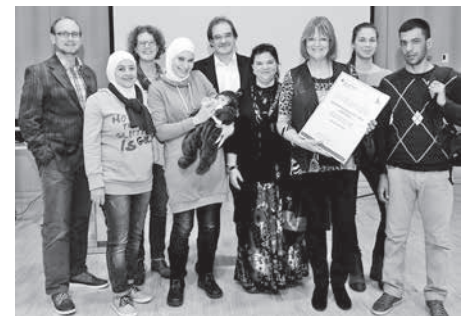
Preisverleihung in der Kreissparkasse Heilbronn am 1. Dezember 2016

Fr., 16.12., ab 15:00 Uhr, offene Weihnachtsfeier des Kraftwerks