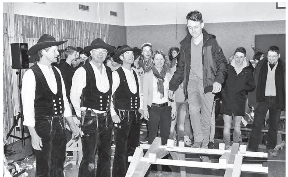
Beim Berufsorientierungs-Theater „Mit Herz und Hand“ erlebten Güglinger Schüler das Zimmermannshandwerk in zahlreichen Facetten.