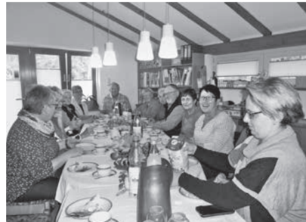
Beim gemütlichen Beisammensein im Personalraum.

Es gibt Menschen dieser Art und es gibt Menschen jener Art. Doch die Menschen, die ich wirklich mag, sind solche deiner Art. Schön, dass es dich gibt! Wir freuen uns auf die weitere gute Zusammenarbeit – Die Kinder und Erzieherinnen der Evang. Kita Gottlieb Luz