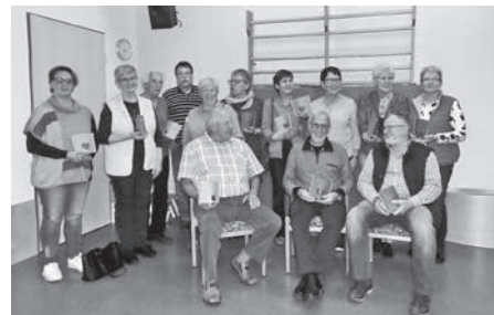
Freude über den gelungenen Nachmittag