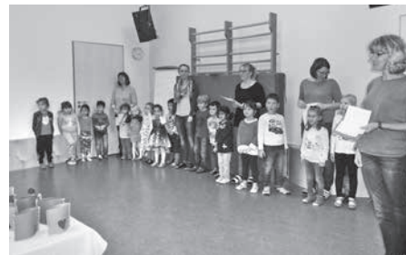
Die Kinder überraschen mit Lied und Geschenken.