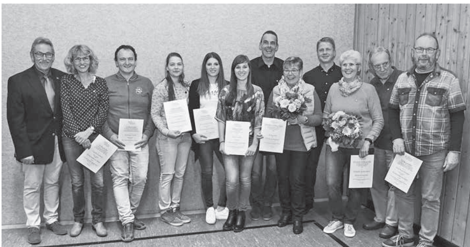
Verdienstvolle und langjährige Vereinsmitglieder wurden bei der Jahreshauptversammlung des TSV Güglingen geehrt.