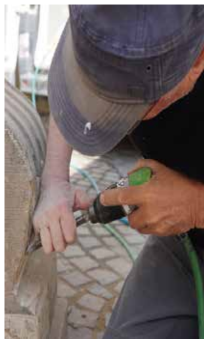
Güglinger Marktbrunnen wird restauriert Steinmetzmeister Wütherich mit Dampfstrahler und Meißel