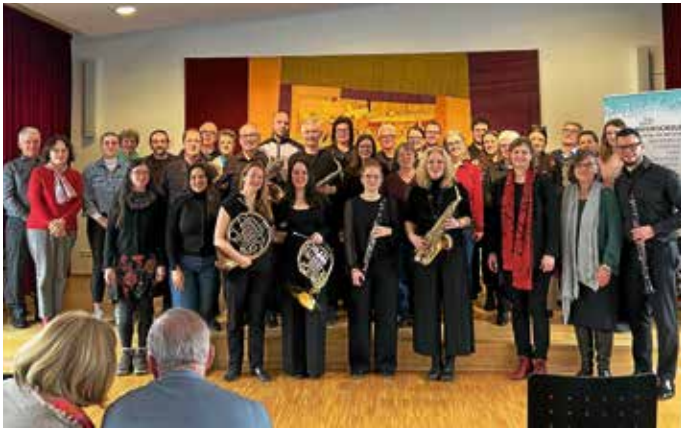
Musizierstunde für Erwachsene 2025

Im Jahr 2023 veranstalteten wir erstmalig eine interne Musizierstunde für erwachsene Schüler/-innen. Egal ob Anfänger oder Wiedereinsteiger, im solistischen oder gemeinsamen Musizieren galt es den Mut zum Vorspiel aufzubringen und das Lampenfieber zu besiegen. Bei der nunmehr 3. Ausgabe dieses besonderen Konzertes wird der Platz auf Bühne und im Zuschauerraum nun so langsam knapp. Insgesamt 30 Musizierende konnten in gut anderthalb Stunden mit abwechslungsreichen und kurzweiligen Beiträgen ihre Angehörigen begeistern.