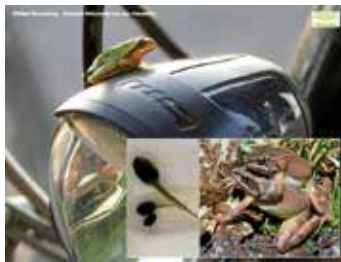
Kaulquappen, Springfrösche, Laubfrosch

Mehr als jede dritte wildlebende Tier- und Pflanzenart ist in ihrem Bestand gefährdet. Hauptgründe des dramatischen Arten- und Individuenrückgangs sind Lebensraumzerstörung, Anreicherung von Giftstoffen in der Umwelt und der Klimawandel. Der Mensch als Teil der Evolution ist aber auf eine intakte Lebensumwelt angewiesen. Man denke