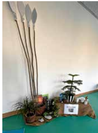
Im Garten Gethsemane

In den beiden Wochen vor Ostern wurden im Bewegungsraum kindgerechte Osterstationen aufgebaut. An sechs Stationen begleiteten die Kinder Jesus und Petrus vom Garten Gethsemane bis zur Auferstehung Jesu. Sie lernten dabei, dass an Ostern das Leben gefeiert wird, das Jesus uns geschenkt hat. Denn, wie es in dem Lied weiter heißt, „Jesus ist mein bester Freund.“