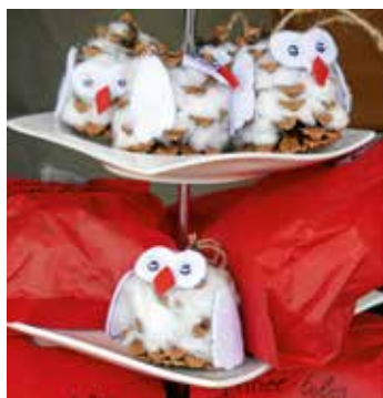
Hübsche Basteleien gibt es auf dem Güglinger Weihnachtsbummel.

Alle Jahre wieder am ersten Advent, also am Sonntag, 30. November, findet in Güglingen der Weihnachtsbummel statt. Von 11.00 bis 18.00 Uhr verkaufen Vereine, Firmen, Gastronomen, Kindergärten und Schulklassen leckere weihnachtliche Gerichte. Posaunenchor und Musikverein bereichern das Programm des Weihnachtsmarkts mit ihren Auftritten.