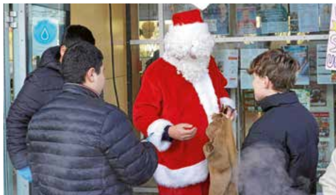
Nicht nur Kinder freuen sich über einen Besuch des Weihnachtsmanns.

schen Hof hin erstrecken. Die Stände locken mit duftenden Leckerbissen und schönen Dekorationsobjekten für eine heimelige Advents- und Weihnachtszeit. Ob Thüringer Rostbratwürste, pikante Waffeln, gebrannte Mandeln oder Linsensuppe mit frischem Ingwer – beim Güglinger Weihnachtsbummel findet jeder Gast etwas Köstliches. Die Mediothek ist mit einem Medienflohmarkt am Start, das Kraftwerk beteiligt sich mit einer Indoor-Shoppingmeile sowie einer Kaffee- und Kuchentafel, auch das Römermuseum ist geöffnet und sorgt für gute Laune. Der Posaunenchor lässt um 15.00 Uhr festliche Klänge vom Kirchturm der Mauritiuskirche erklingen. Am späteren Nachmittag können Weihnachtslieder mit Gitarrenbegleitung am Stand des Naturkindergartens Waldelfen gesungen werden. Der Weihnachtsmann darf auch dieses Mal beim Güglinger Weihnachtsbummel nicht fehlen.