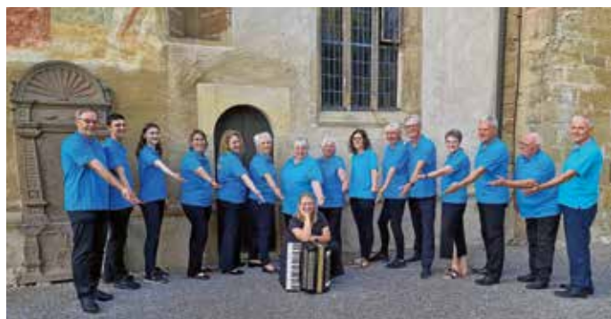
BelAkkord spannt beim Konzert seinen Bogen von unvergessenen Popballaden über Filmthemen zu energiegeladenen Rocksongs.

Ein Abend voller Klang, Gefühl und Gänsehaut verspricht das Konzert von BelAkkord am Samstag, 22. November, 19.00 Uhr , im Rathausfoyer zu werden. Wenn im Güglinger Rathshöfle die Lichter ausgehen und der Raum unter der Glaskuppel im warmen Schein unzähliger Kerzen erstrahlt, beginnt ein Abend, der Musikliebhaber quer durch alle Generationen begeistert. Das Akkordeon-Orchester BelAkkord aus Brackenheim lädt zu einem Candlelight-Konzert ein – außergewöhnlich, atmosphärisch und mitreißend.