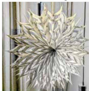
Stern aus Sternepapiertüten

Alle, die sich gerne kreativ auf Weihnachten einstimmen wollen, laden wir zum „Sternbasteln“ ein.