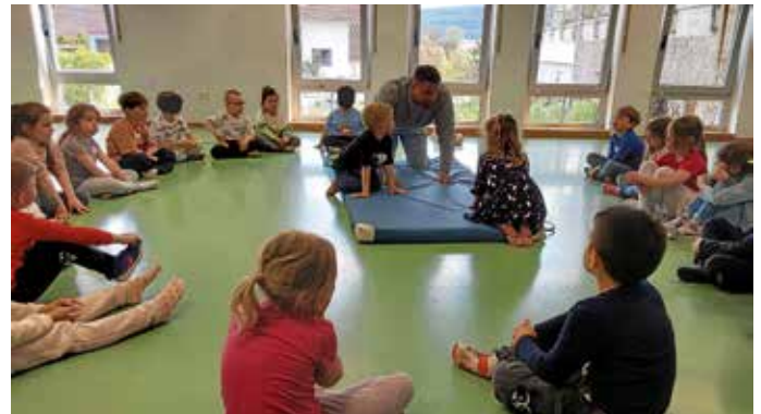
und lauschten konzentriert dem Trainer.