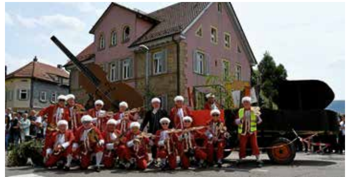
Fantasievoller Wagen aus dem Vorjahresumzug am Pfingstmontag.

Die Abholung des Birkengrüns ist möglich am Pfingstmontag von 8.00–9.30 Uhr im Städtischen Bauhof Güglingen.