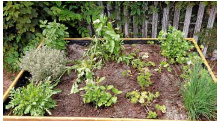
Vielfältige Kräuter-Auswahl im Hochbeet.

Damit die darin wachsenden Pflanzen auch genutzt werden können, haben wir uns dafür entschieden, das Hochbeet mit Küchenkräutern zu bestücken. Diese können von den Hauswirtschaftskräften für die Zubereitung des Essens verwendet werden.