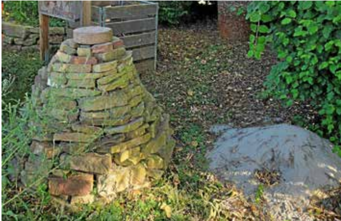
Schöner Hingucker im naturnahen Garten: Ein Plätzchen für kleine Lebewesen.

einen wichtigen Beitrag zur Förderung der Artenvielfalt und zur ökologischen Aufwertung privater Grünflächen in Güglingen. Gärten, die sich aktuell in der Umwandlung vom Schottergarten zum Naturgarten befinden, waren in diesem Jahr trotz des ausgeblöbten Sonderpreises noch nicht dabei.