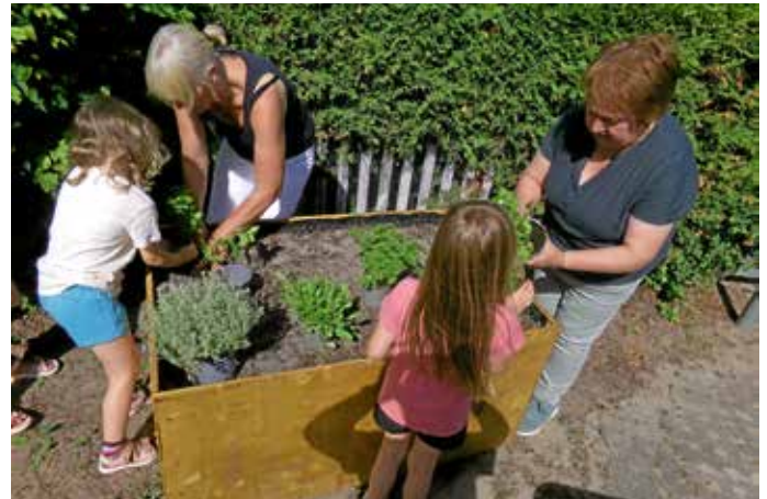
Kinder helfen beim Bepflanzen.