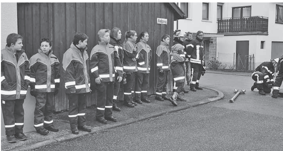
Die Jugendfeuerwehr begleitete die Übung als Zuschauer und „Verletzte“