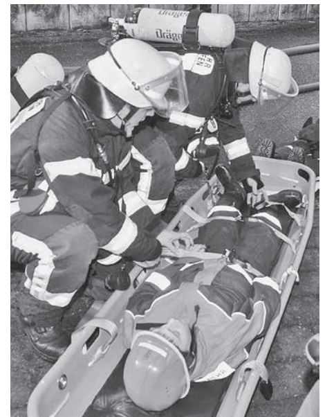
Bergung der Verletzten durch die Atemschutzträger