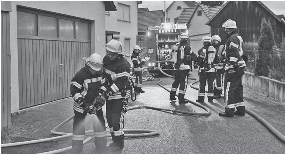
Einsatz in der Badgasse mit dem neuen LF 10