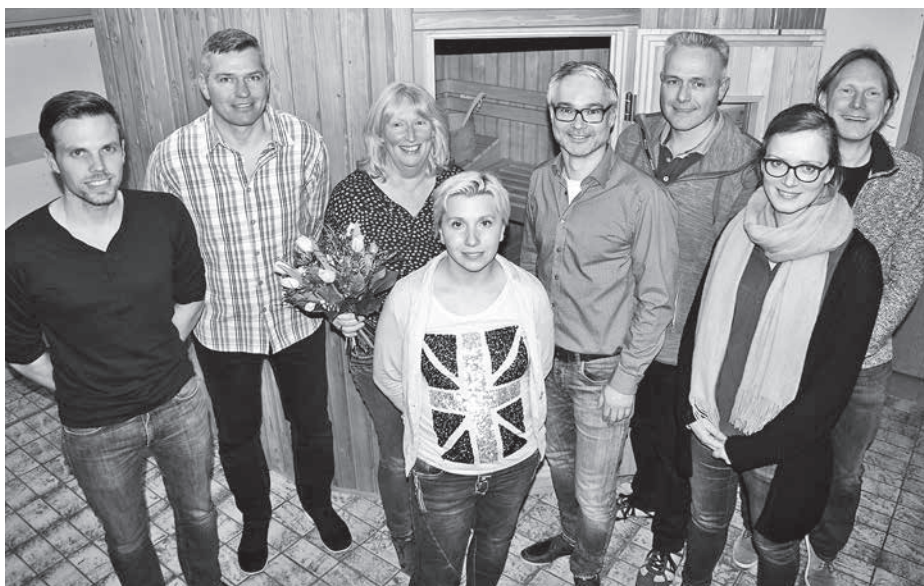
Der Vorstand des SV-Frauenzimmern präsentiert sich vor der neuen, eigenen Sauna, die die Sportler seit wenigen Monaten im Keller des Sportheims nutzen können.