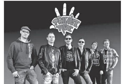
Die Zabergäu-Rocker von Private Five wollen in der Wilhelm-Widmaier-Halle wieder ein richtiges Spektakel inszenieren.