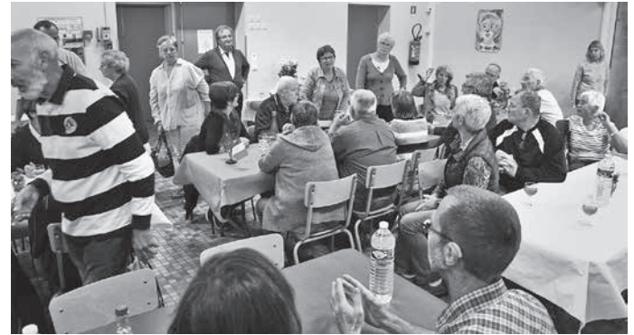
Herzliche Willkommensgrüße und freudige Begrüßung am Freitagabend.

Nach der Quartierverteilung und dem gemeinsamen Abendessen wurde ausreichend Gelegenheit gegeben, sich im kleinen Saal der Gemeindehalle von Aunay auszutauschen.