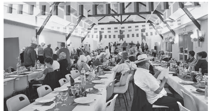
Impressionen vom Festabend mit der Ausstellung im Foyer und der Dekoration im Saal.