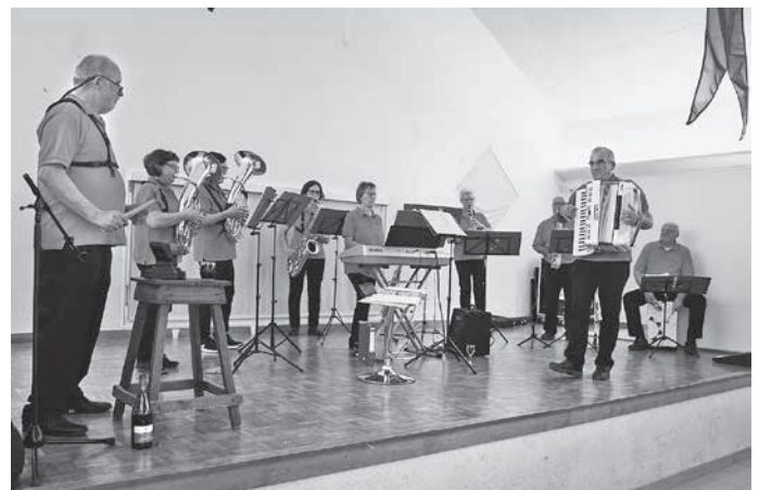
Unterhaltende Elemente beim Festakt mit Tänzen aus Beville le Comte und Musik aus Güglingen.