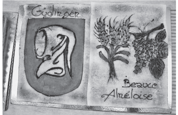
Ein „Fest“ für Augen und Gaumen – das Buffet beim Festakt.

Sonntags war dann ein Ausflug nach Chartres angesagt. Unter fachkundiger Führung kreiste man die Kathedrale ein und wurde auf dem zweistündigen Rundgang dazu animiert, diese Stadt beim nächsten Ausflug länger zu besuchen.