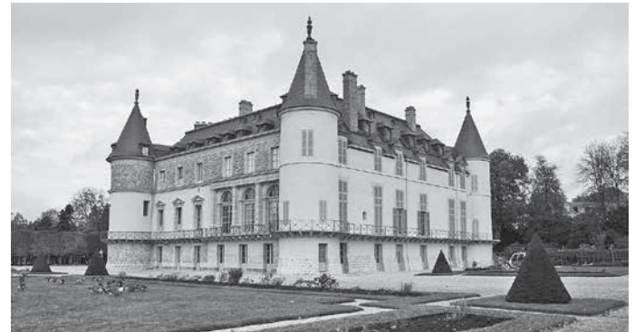
Ausflug nach Rambouillet mit Markt- und Schlossbesuch.

Am Samstagmorgen stand ein Ausflug nach Rambouillet auf dem Programm. Bei einem Bummel über den Wochenmarkt war schnell zu erkennen, wie sich die Franzosen gastronomisch auf das Wochenende einstellen. Es blieb auch noch Zeit dafür, das dortige Château von außen zu besichtigen. Dort empfängt der französische Präsident in aller Regel seine Staatsgäste.