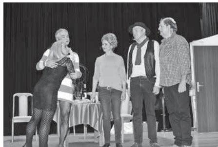
Theater: „Emanzen kochen besser“. Das turbulente Theaterstück sorgte mit Irrungen und Verwandlungen für viele Lacher im Publikum.