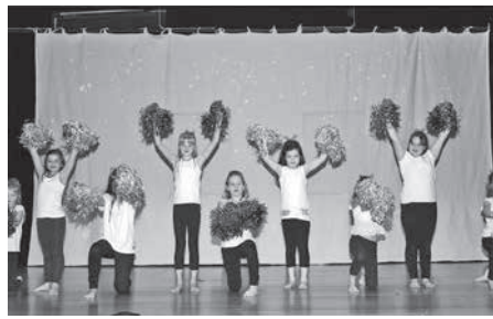
Mit glitzernden Pompons zeigten die Dancing Queens des SV Frauenzimmern bei der Winterfeier in der Güglinger Herzogskelter ihr Können.