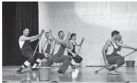
Als heiße Feger präsentierten sich die aktiven Fußballer.