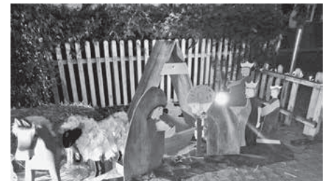
Nikolausfeier Kindertagesstätte „Heigelinsmühle“

Ein geheimnisvoller Brief sorgte während der Nikolausfeier in der Kindertagesstätte Herrenäcker für staunende Gesichter. Schnell stellte sich heraus, dass der Absender des Briefes der Nikolaus war. Er hatte zwei Säcke im Kindergarten abgeliefert, die mit großer Spannung ausgepackt wurden. Besonders freuten sich die Kinder über Eintrittskarten für das Theater „Halleluja, wir folgen dem Stern“ am folgenden Tag in der Herzogskelter Güglingen.