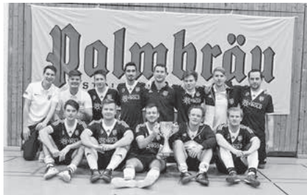
Die Mannschaft der Sportfreunde Lauffen freut sich über den Gewinn des Palmbrau-Cup.

macht hat. Am Ende gewannen sie mit 4:2. Trotz der Niederlage im Finale konnte man aber mit dem Auftreten unserer Teams absolut zufrieden sein. Während sich die erste über Platz zwei freuen konnte, unterlag die zweite Mannschaft im Spiel um Platz fünf nur knapp im 9 m-Schießen gegen den GSV Eibensbach.